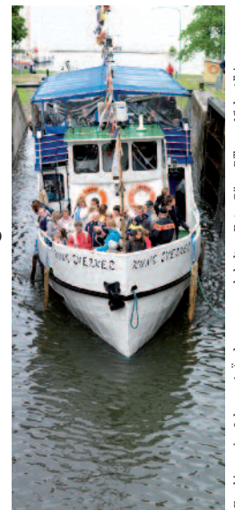
Fotografieren im Jahr 2016. Änderungen vorbehalten.

M/S Bellevue, Sjötorp-Töreboda, Mariestads Skärgårdstrafik, 0501-514 70 M/S Modig, Karlsborg-Motala Mariestads Skärgårdstrafik, 0501-514 70 M/S Kung Sverker, Motala-Borensberg, Motala Kanaltrafik, 070-626 02 49 M/S Ceres, Borensberg-Berg, Borensberg-Motala PnP Rederi, 0771-50 50 60 M/S Prinsen, Berg-Malfors, Motala Kanaltrafik, 070-626 02 49 M/S Wasa Lejon, Berg-Borensberg, Royal Stockholm Cruise Line, 011-12 78 01 M/F Lindön, Söderköping-skärgården, Söderköpings Brunn, 0121-109 00 M/S Diana, Juno och Wilhelm Tham, Göteborg-Stockholm, Motala-Söderköping, Rederi AB Göta Kanal, 031-80 63 15 Hjulångaren Eric Nordevall II, Forsvik, Vättern 0505-412 50